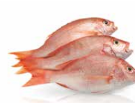
Fische, 20 kg**

Frische, ausgenommene Fische oder Fischereierzeugnisse (frisch, getrocknet, gekocht, geräuchert, anderweitig haltbar gemacht), inklusive Krebs- und Weichtieren (nicht lebend)